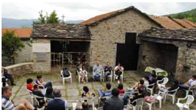
Incontro nell'aia di Cervarolo all'interno del percorso "Samarotto sopra le nuvole"

Festa della Repubblica. Boretto - Albinea: consegna della costituzione ai diciottenni