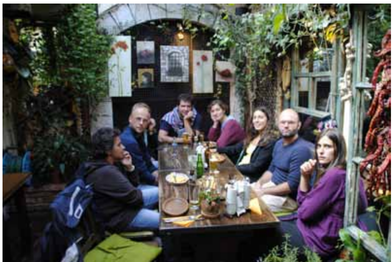
Un momento della missione a Sarajevo