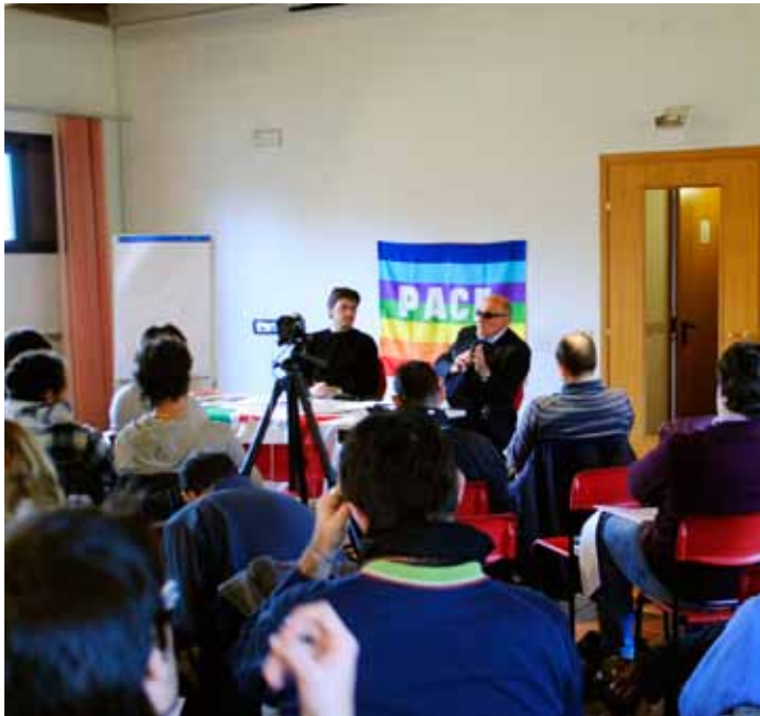
Don Giuseppe Dossetti interviene alla Scuola di politica di Montesole